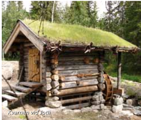
Kvärnen vid Jotli