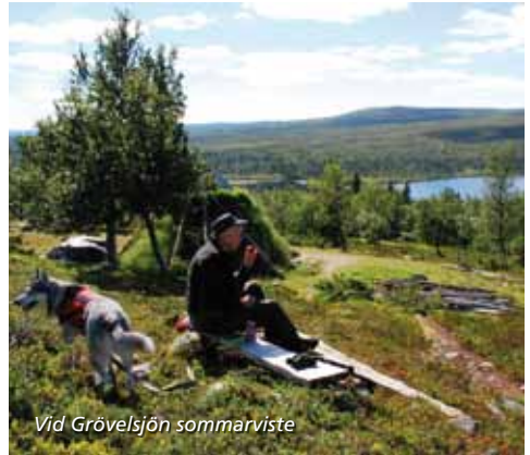
Vid Grövelsjön sommarviste

Nära vägen finns också en nyare cirkelsåg, driven av en ovanligt stor och häftig tändkulemotor. I samma byggnad finns också en prototyp till dagens sk Solo-sågar, kända över hela världen, och framtagen av uppfinnaren Jöns Olsson från Floåsen. Varje år arrangeras Gammelsågens dag förutom i år då sågen renoveras.